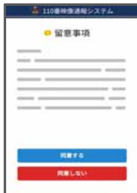
▲留意事項画面のイメージ