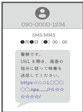
▲SMS受信画面のイメージ